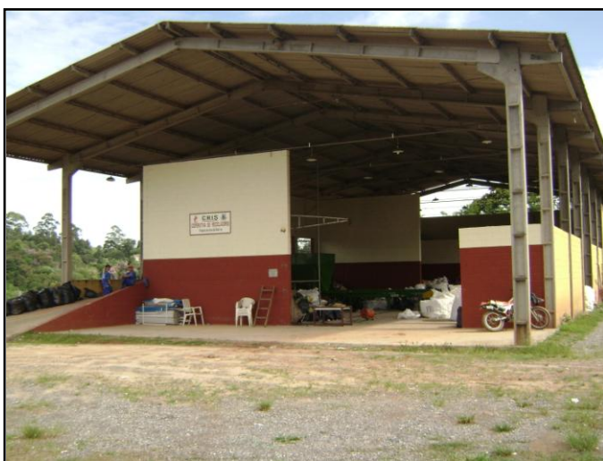
Galpão - Centro de triagem

O material coletado no Município é enviado para o Centro de Triagem localizado no bairro do Potuverá, onde são separados pelos cooperados.