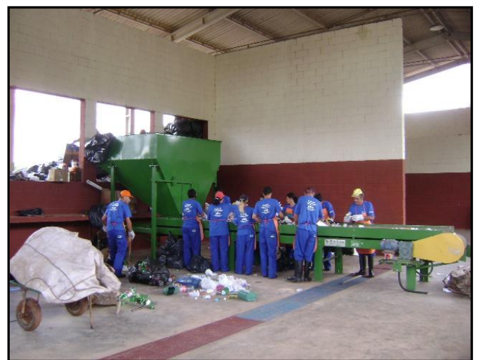
Cooperados na separação dos materiais