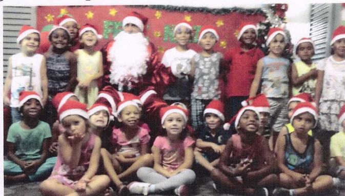
Turma da Manhã