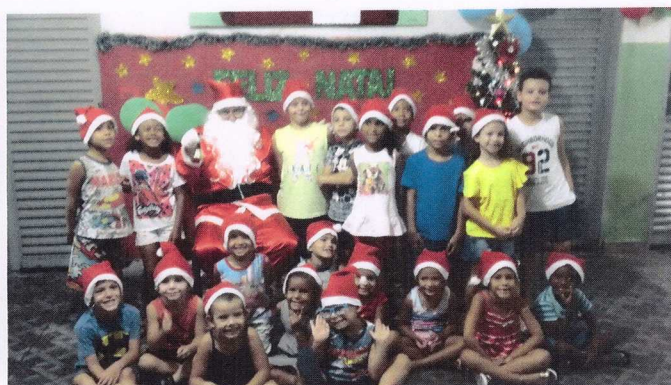
Turma da Tarde